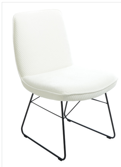
1A - Stuhl mit Drahtkufe in Metall schwarz Struktur