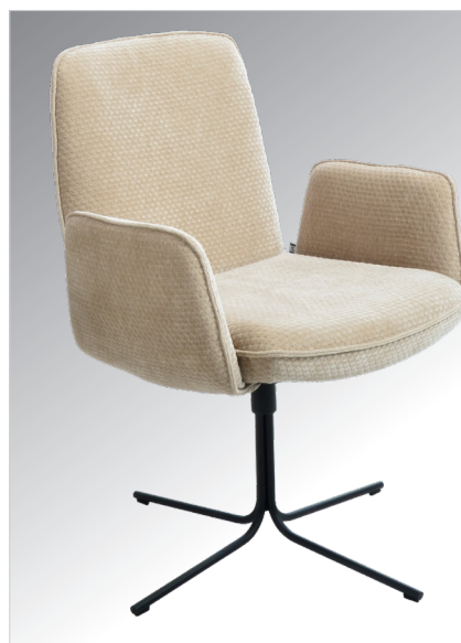
AB - Armlehnstuhl mit 4-Stern-Drehkreuz schmal in Metall schwarz Struktur