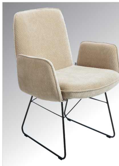
1B Armlehnstuhl mit Drahtkufe in Metall schwarz Struktur