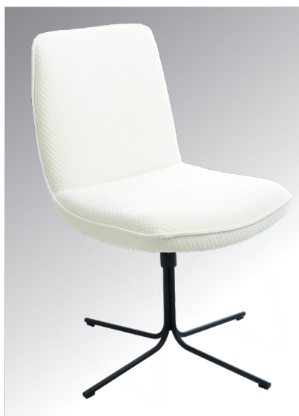
AA - Stuhl mit 4-Stern-Drehkreuz schmal in Metall schwarz Struktur