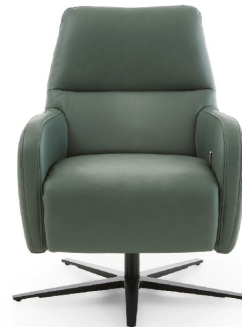
1D - Rücken niedrig ohne Kopfpolsterverstellung