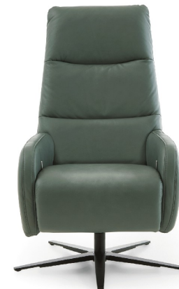
1DKV - Rücken hoch inkl. Kopfpolsterverstellung

Bitte alle erforderlichen Vorgaben zu einer Bestellung beachten. Beginnen Sie Ihre Angaben mit der davorstehend linken Type. (Bitte Stellskizze mitsenden)