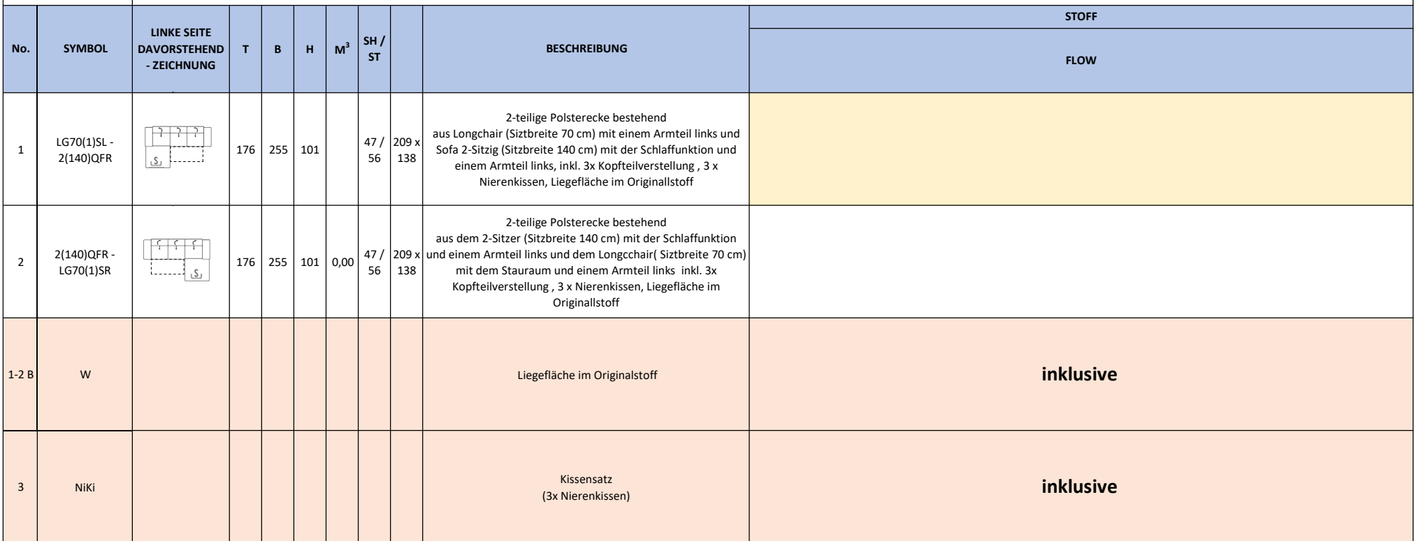
Foto Typ: Longchair (Sitzbreite 70 cm) mit einem Armteil links und Sofa 2-Sitzig (Sitzbreite 140 cm) mit der Schlaffunktion und einem Armteil rechts, inkl. 3x Kopfteilverstellung, 3 x Nierenkissen, Liegefläche im Originalstoff, Bezug: Flow 04 beige