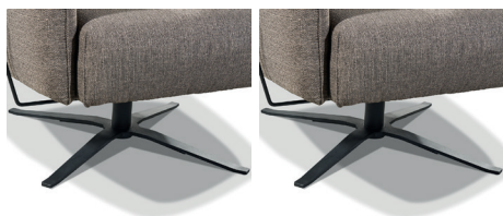
1213 4-Sternfuß farbig für Sessel (gegen Aufpreis) 1231 4-Sternfuß farbig für Hocker (gegen Aufpreis)