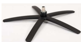
SBS Sirius Base - Schwarz