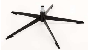
OS Orion Base - Chrom