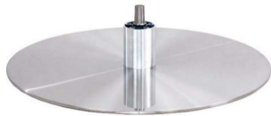
DBB Diskfuß - Metall gebürstet (Gaslift-Höhenverstellungs-Option nicht möglich)