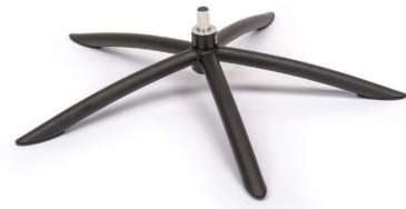
TSS2 Tube Space Metall Schwarz (Gaslift-Höhenverstellungs-Option nicht möglich)

Tube Space TS oder TSS2: Sessel H: +2 cm, SH +2cm