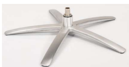
SB Sirius Base - Silver

Für alle Fußvarianten WS Holzstern Gaslift- Höhenverstellung s- Option nicht möglich