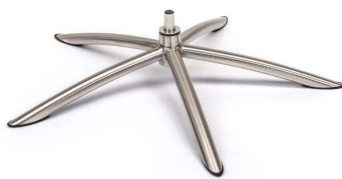
TS Tube Space Metall gebürstet (Gaslift-Höhenverstellungs-Option nicht möglich)