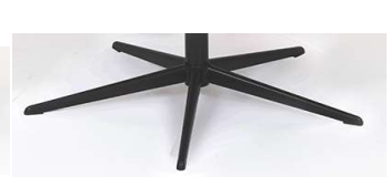
PB Polaris-Base - Chrom