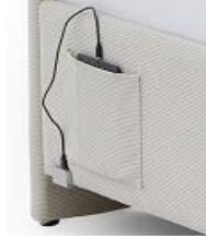
2 Betttaschen und USB-Anschluss