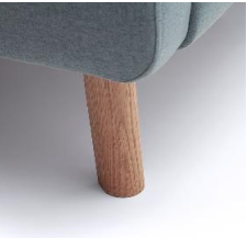
Holzfuß massiv, eichefarbig