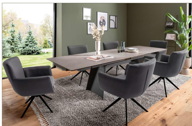
Stuhl WILSON mit Tisch VOLUNARA