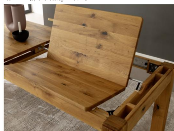
Tisch ETNA mit Butterflyauszug