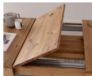
Tisch ETNA mit Synchronauszug