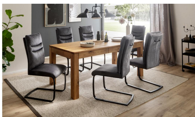
Tisch ETNA (Synchronauszug) mit Stuhl GIBARA