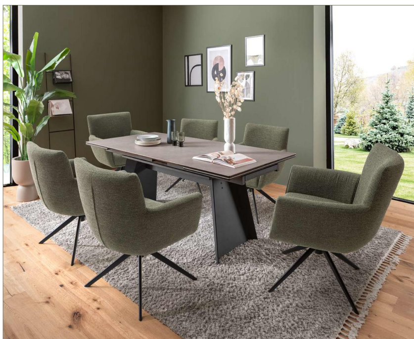
Stuhl WILSON mit Tisch VOLUNARA