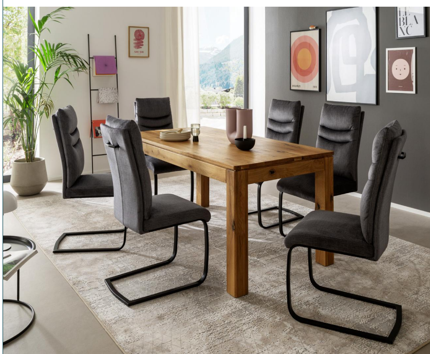
Tisch ETNA (Butterflyauszug) mit Stuhl GIBARA