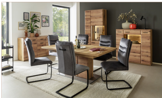
Schwingstuhl GIBARA mit Kastenmöbelprogramm NAXOS