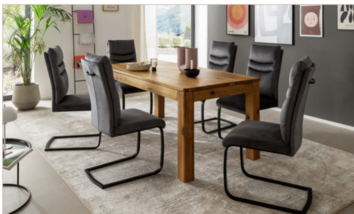
Schwingstuhl GIBARA mit Tisch ETNA