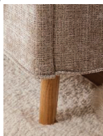
Holzfuß massiv, eichefarbig