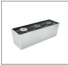
KC 17 (H 6,5 cm) Kunststoff-Chrom