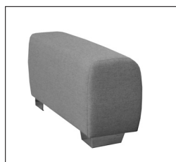
Armlehne „B“ Breite: ca. 30 cm