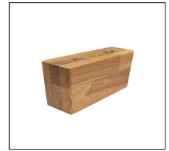
H 256 (H 6,5 cm) Eiche 400, geölt