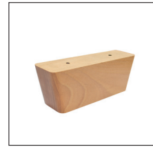
H 155 (H 6,5 cm) Buche: – natur Nr. 108 – wenge Nr. 119 – schwarz Nr. 250