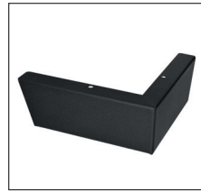
S 250 (H 6,5 cm) Metall, Schwarz pulverbeschichtet