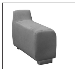
Armlehne „A“ Breite: ca. 30 cm

Achtung: Die Armlehnen sind nicht zum Sitzen geeignet. Die maximale Belastbarkeit beträgt ca. 25 kg.