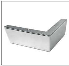
C 250 (H 6,5 cm) Chrom