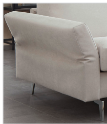
Armlehne Typ 2 (gegen Aufpreis )