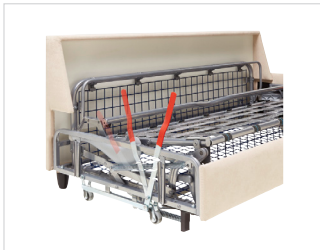
Hebebeschlag Optional gegen Aufpreis Art.-Nr. 9506