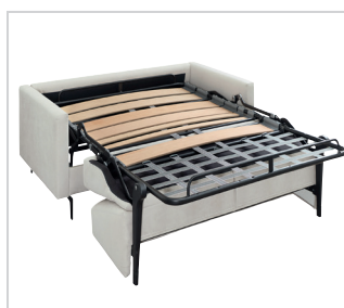
Ergoflex Lattenrost Standard - Ausführung

Art.-Nr. 9766 120 × 200 cm 9767 140 × 200 cm 9768 160 × 200 cm