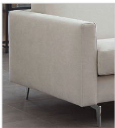
Armlehne Typ 1