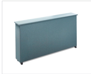
Stauraumbox Optional gegen Aufpreis • Deckel mit mit gedämpften Topfbändern