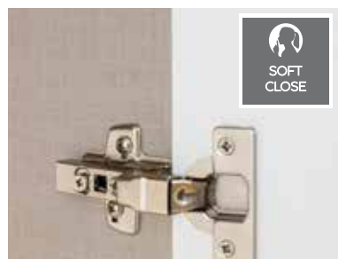
Drehtüren inkl. soft-close