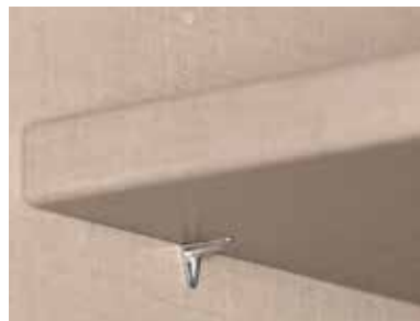
Fachboden 22 mm stark, einfach verstellbar, dank steckbarer Winkelbodenträger