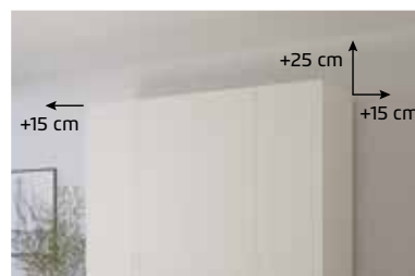
Für die Montage des Schrankes wird folgender Platz benötigt: Schrankhöhe + mind. 25 cm, Schrankbreite + mind. je 15 cm an beiden Seiten.