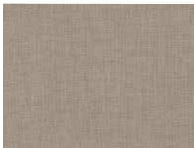
Innenfarbe Dekor-Druck Texline