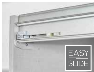
Führungsschienen aus Metall, Schwebetürendämpfer optional