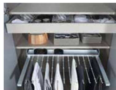
Extras siehe Zubehör FH