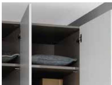
Drehtüren mit Dickkante