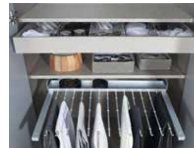
Extras siehe Zubehör FH