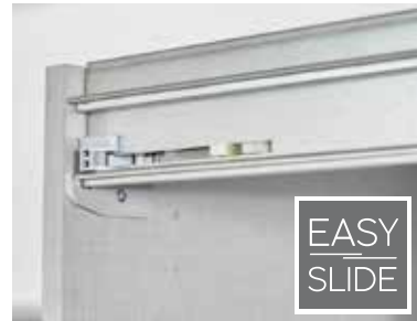
Führungsschienen aus Metall, Schwebetürendämpfer optional