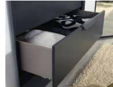
Schubkästen mit Unterflurschiene, Selbsteinzug und Dämpfung.