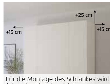
Für die Montage des Schrankes wird folgender Platz benötigt: Schrankhöhe + mind. 25 cm, Schrankbreite + mind. je 15 cm an beiden Seiten.