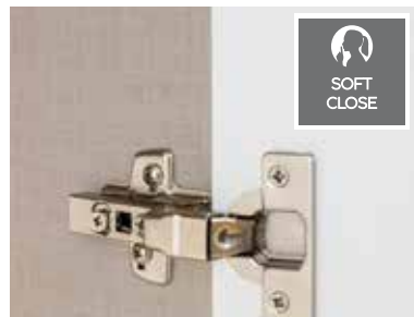
Drehtüren inkl. soft-close