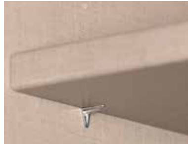
Fachboden 22 mm stark, einfach verstellbar, dank steckbarer Winkelbodenträger