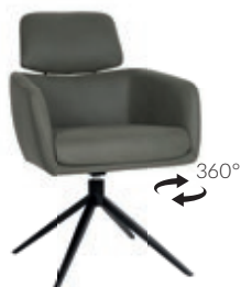
Glatt Bein: Sparkfuss, Stahl Schwarz mit Drehfunktion