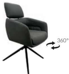
Casual Bein: Sparkfuss, Stahl Schwarz mit Drehfunktion