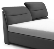
0848 KV Höhe ca. 112-123 cm