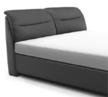
0848 Höhe ca. 112 cm