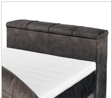
hohes Fußteil inkl. TV-Halterung