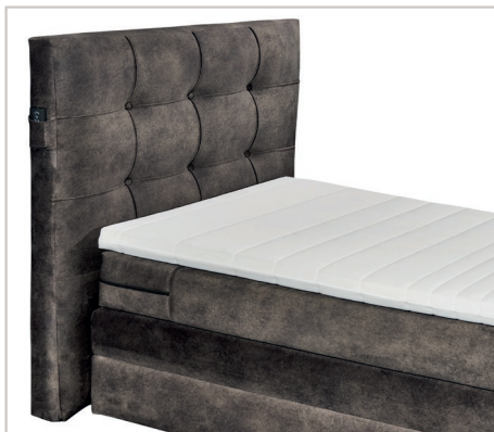
Kopfteil mit Keder und Knopfeinzug in Kassettenoptik-Steppung