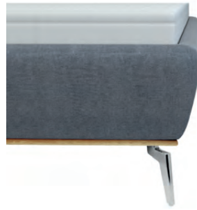
leicht konisch mit Sichtholzrahmen Wildeiche geölt - nur bei Fußhöhe 16 cm lieferbar - Höhe ca. 26 cm inkl. Sichtholzrahmen