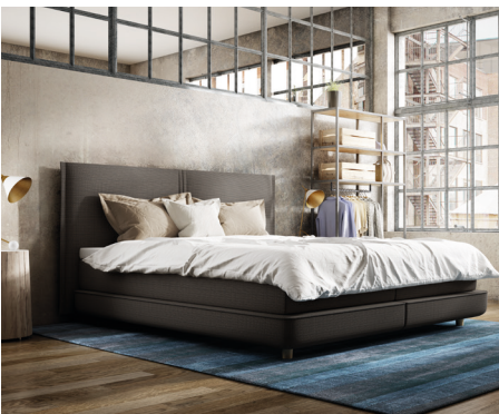
Plattform Box im Milieubild