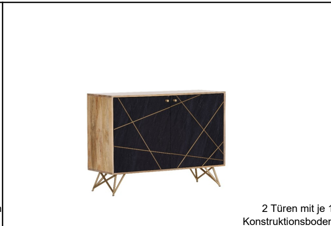
2 Türen mit je 1 Konstruktionsboden