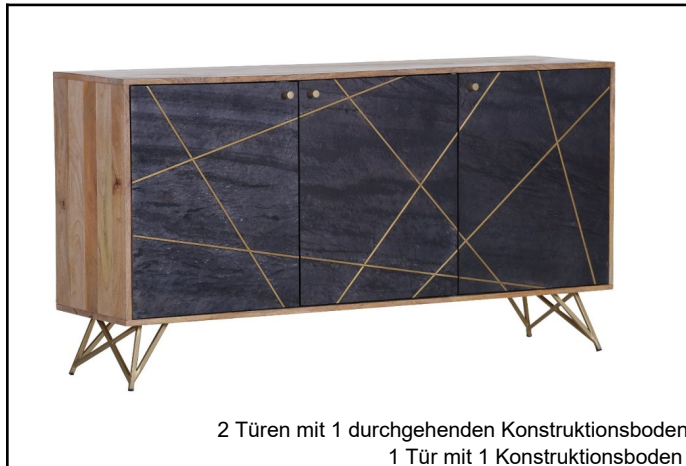
2 Türen mit 1 durchgehenden Konstruktionsboden 1 Tür mit 1 Konstruktionsboden