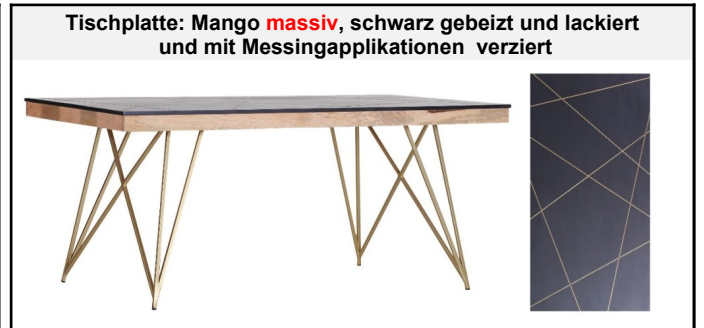
Tischplatte: Mango massiv , schwarz gebeizt und lackiert und mit Messingapplikationen verziert