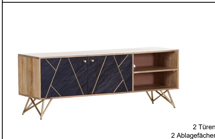
2 Türen 2 Ablagefächer