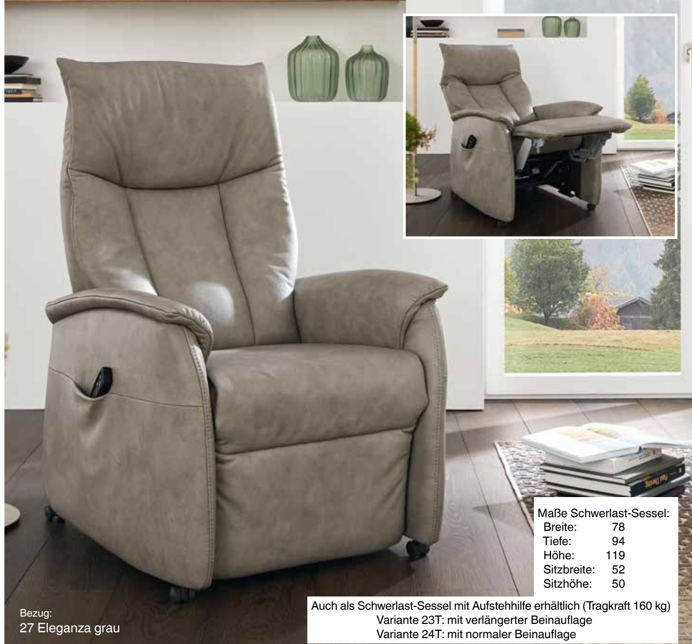
Bezug: 27 Eleganza grau

Maße Schwerlast-Sessel: Breite: 78 Tiefe: 94 Höhe: 119 Sitzbreite: 52 Sitzhöhe: 50