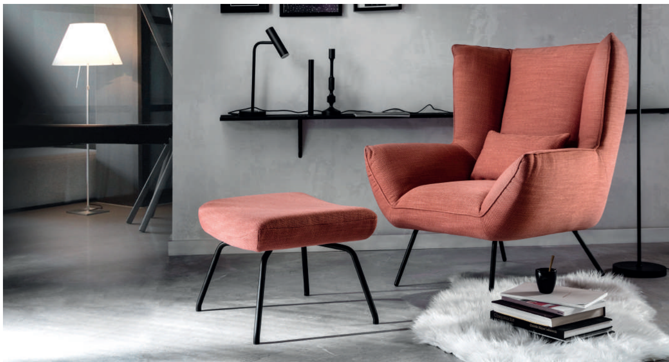
Sessel und Hocker