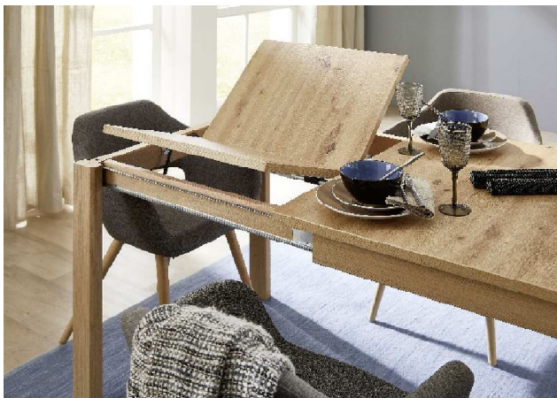
2. Einlegeplatte ausklappen