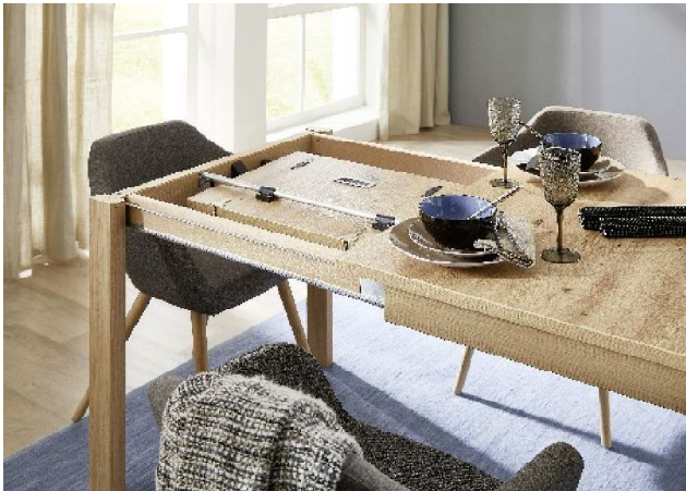
1. Gestell ausziehen

TEF...in der Breite um 60 cm erweiterbar durch eine ausklappbare Einlegeplatte (Butterfly)