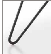
Haarnadelgestell schwarz pulver- besch. F 11