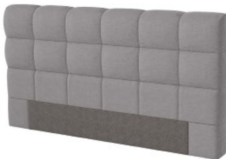
Kopfhaupt SI 12