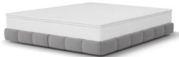
Kopfhaupt SI 11