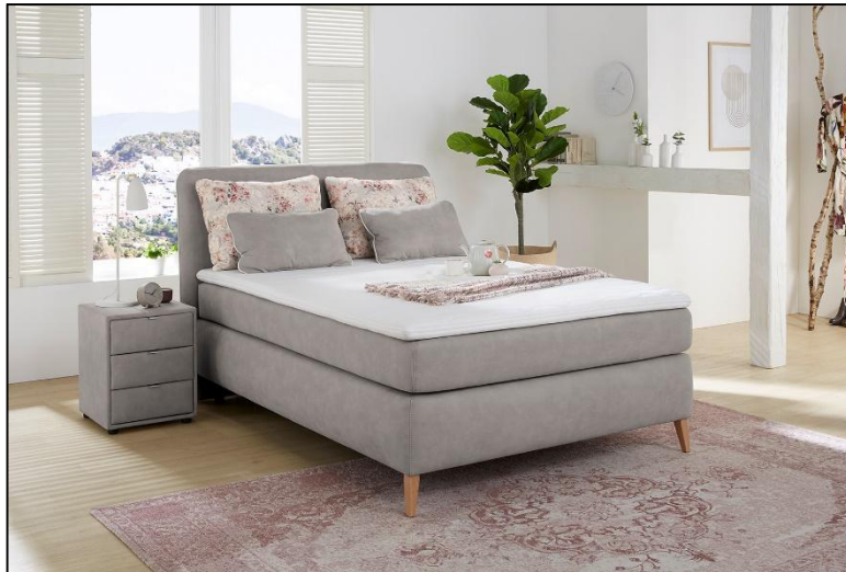
344/19 – 605/05 – 344/19