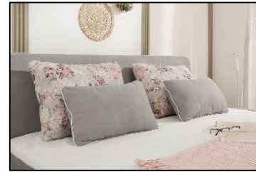
344/19 – 605/05 – 344/19