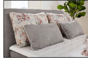
344/19 – 605/05 – 344/19