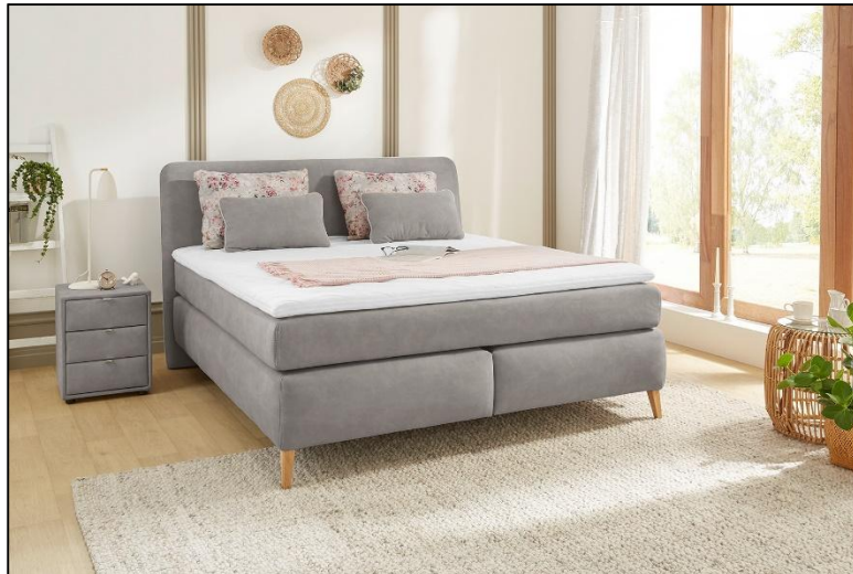
344/19 – 605/05 – 344/19