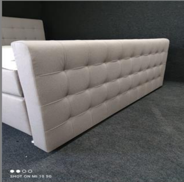
FT Space III