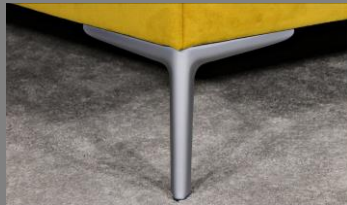
Wing silber matt