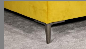
Urban schwarz Chrom