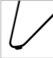
Haarnadelfuß schwarz pulverbe- schichtet