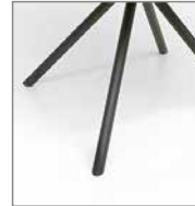
Stativfuß fest schwarz