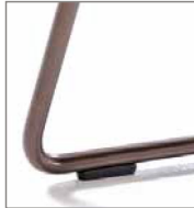
Drahtrohrgestell schwarz pulver- besch.