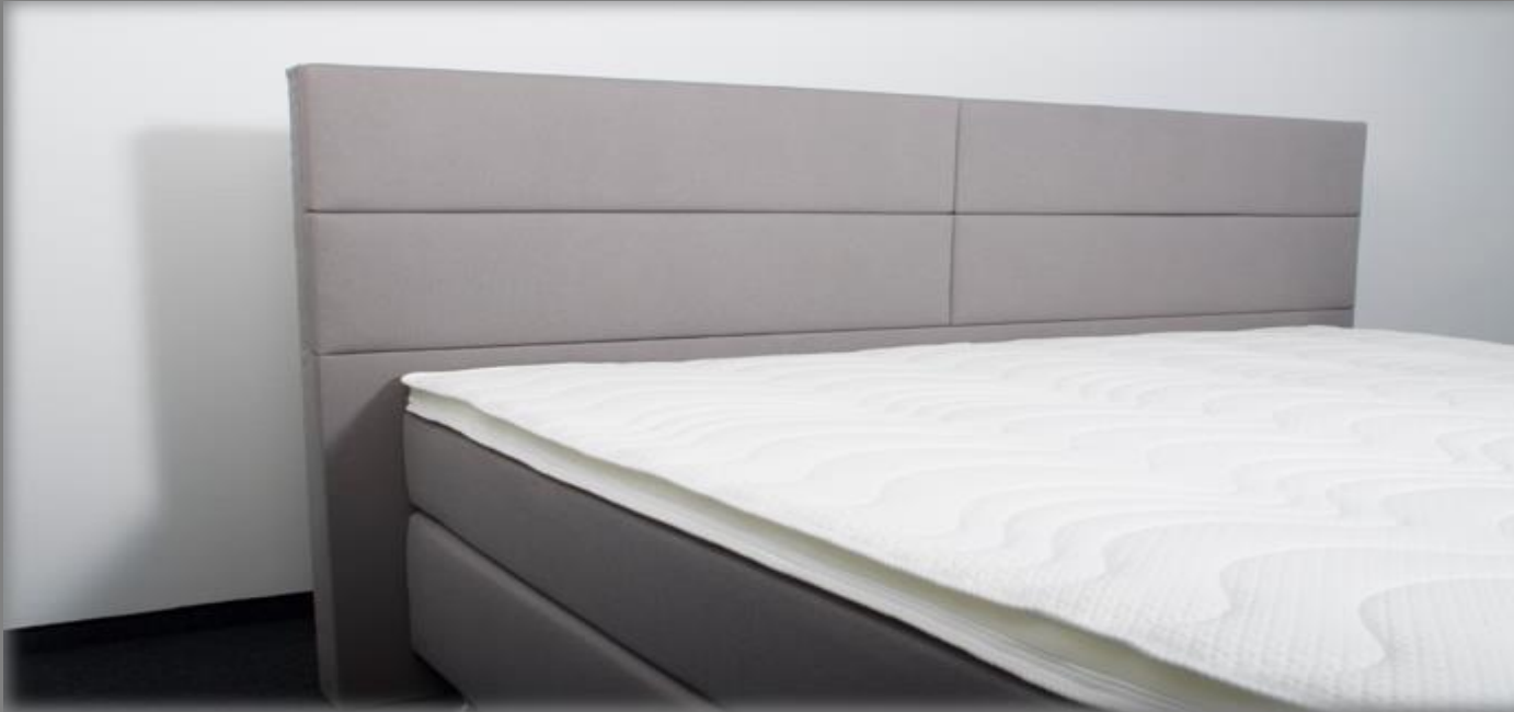
KT Space I