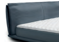
0870 Höhe 104 cm