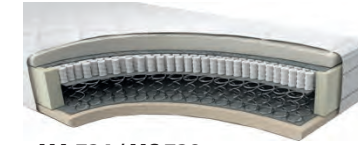
MA 734 / MS 738