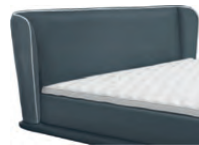
0859 Höhe 115 cm Absatzkeder / gegen Aufpreis