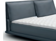
0862RR mit Relaxrücken Höhe 108 cm