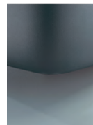
K 08-16 K 08-18 Schwebeoptik