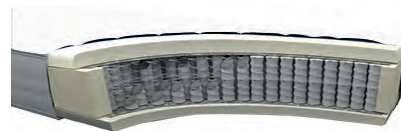
MA 420 / MS 428