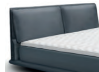
0862 Höhe 108 cm