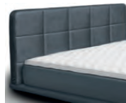
0834 Höhe 112 cm