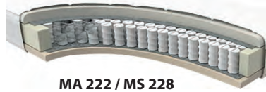
MA 222 / MS 228