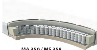
MA 350 / MS 358