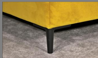
Urban schwarz matt