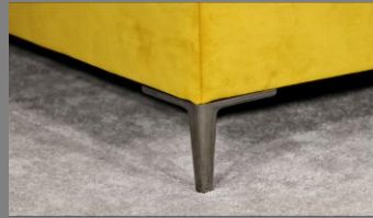
Urban schwarz chrom