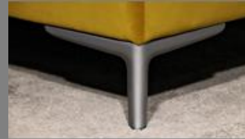
Wing silber matt