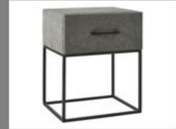
Nachttisch Frame La