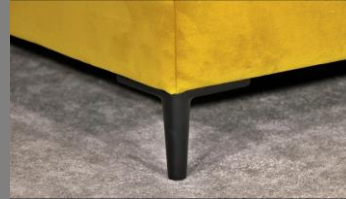
Urban schwarz matt