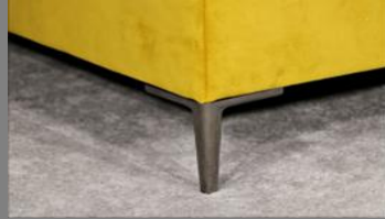
Urban schwarz Chrom