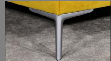
Wing silber matt