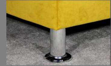
Vitalis Alu rund