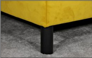
Holz rund schwarz