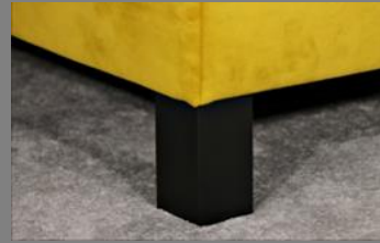
Holz viereckig schwarz