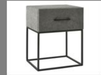
Nachttisch Frame La