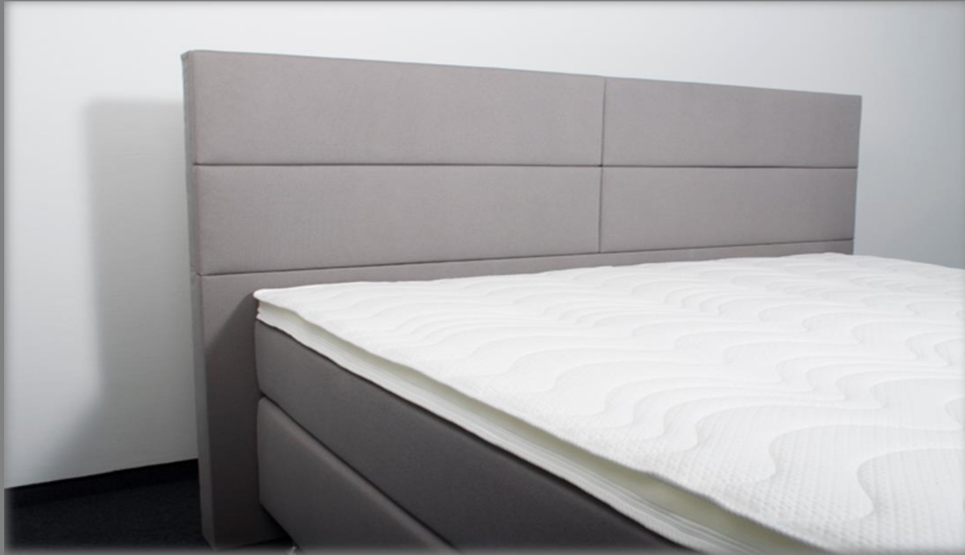
KT Space 1