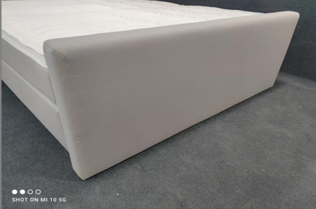
FT Space 1