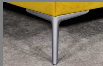
Wing silber matt