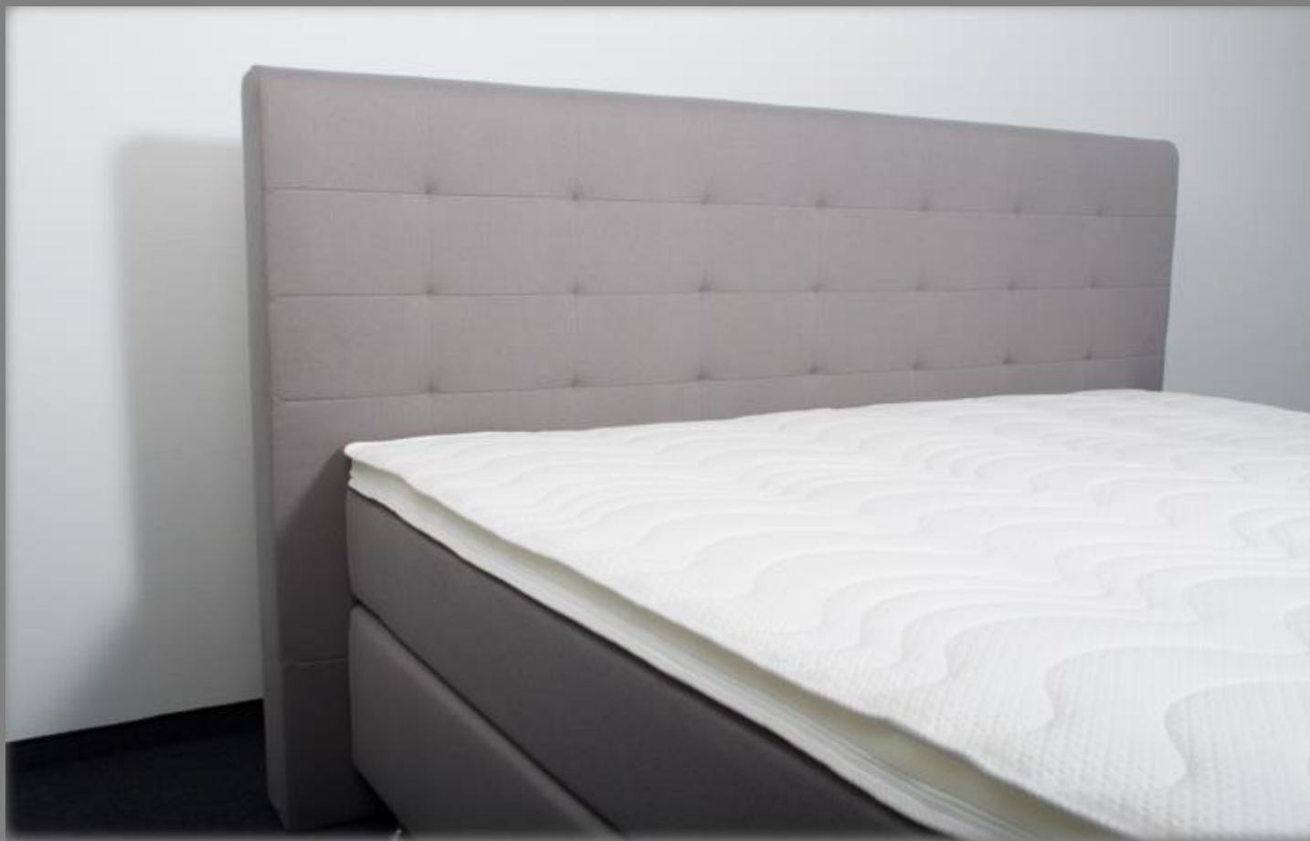
KT TM 1