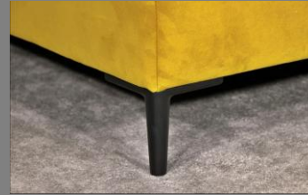
Urban schwarz matt