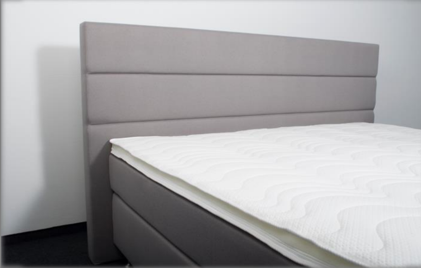
KT TM 3