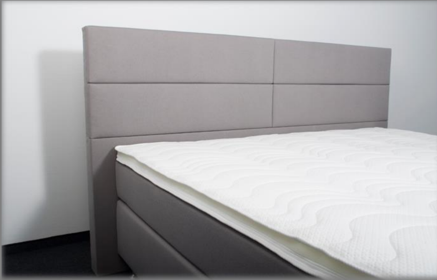
KT Space 1