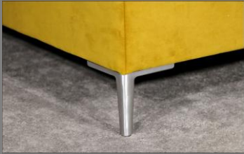
Urban Alu gebürstet