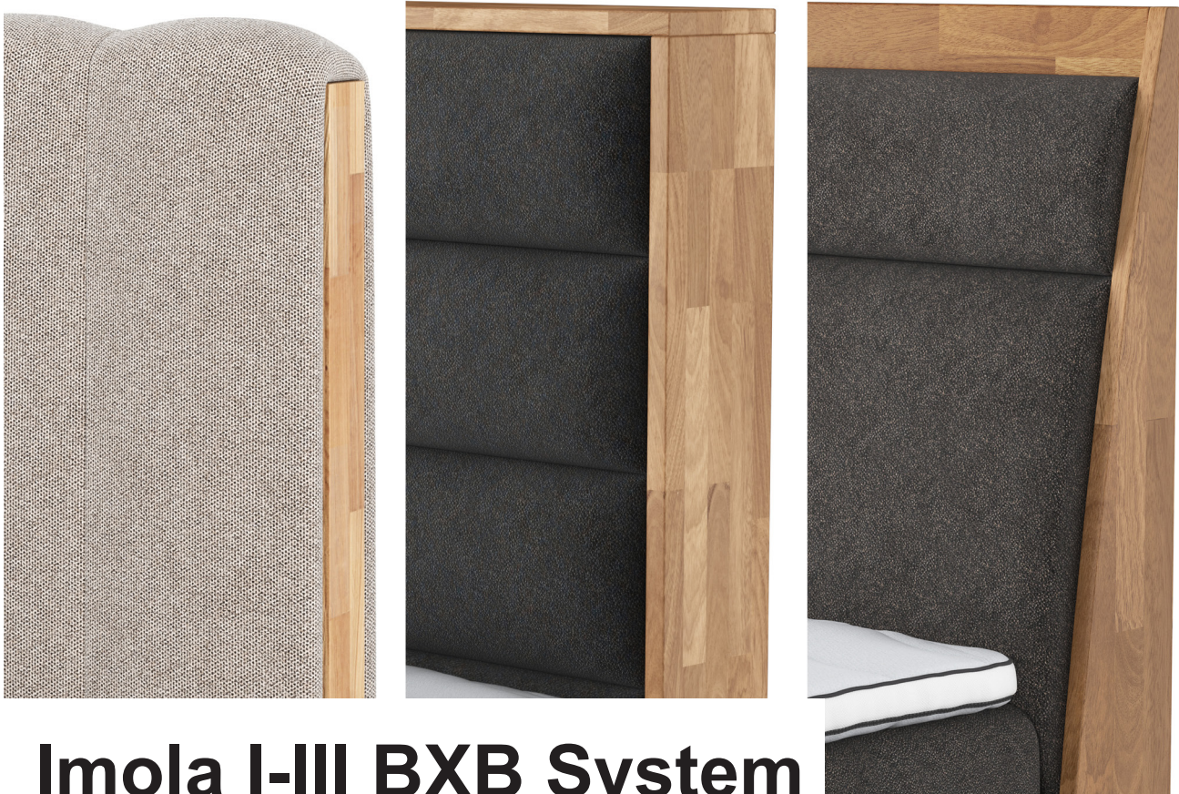
Imola I-III BXB System