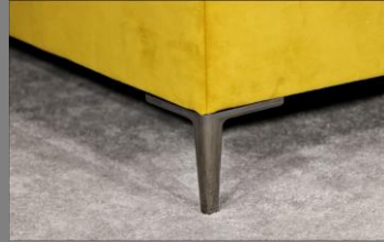
Urban schwarz Chrom