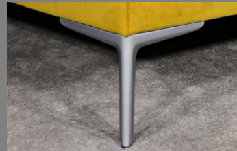
Wing silber matt