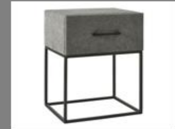
Nachttisch Frame La