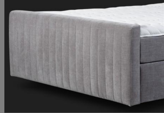
FT Topmotion 14