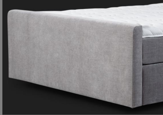
FT Topmotion 13