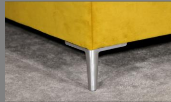
Urban Alu gebürstet