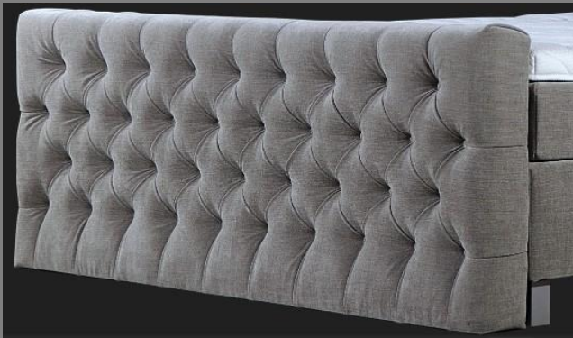
FT Topmotion 5