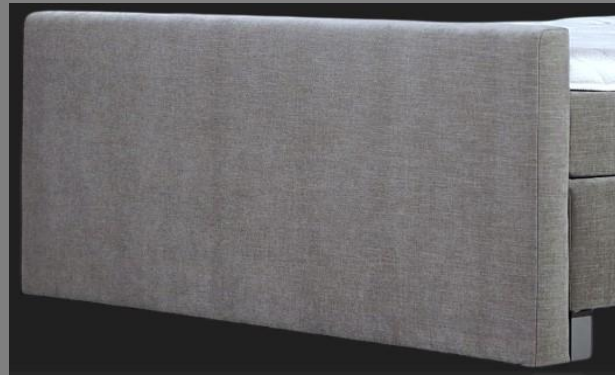
FT Topmotion 10