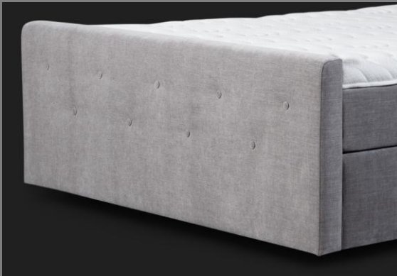
FT Topmotion 15