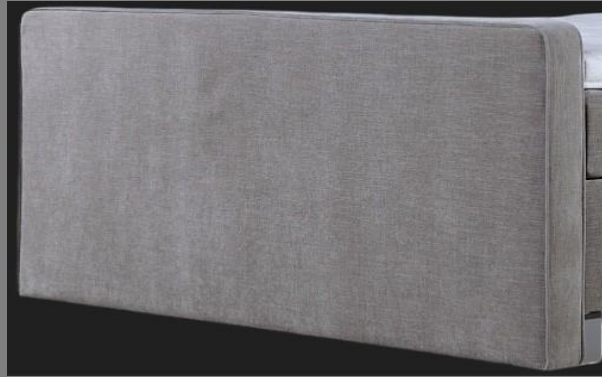
FT Topmotion 2