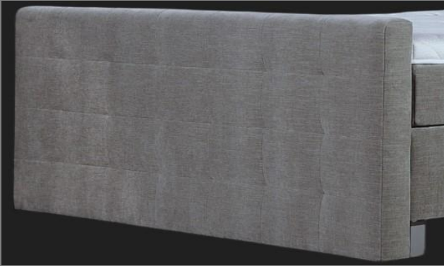
FT Topmotion 1