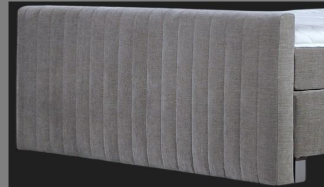
FT Topmotion 11