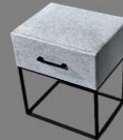
Nchttisch Fame La