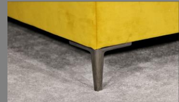
Urban schwarz Chrom