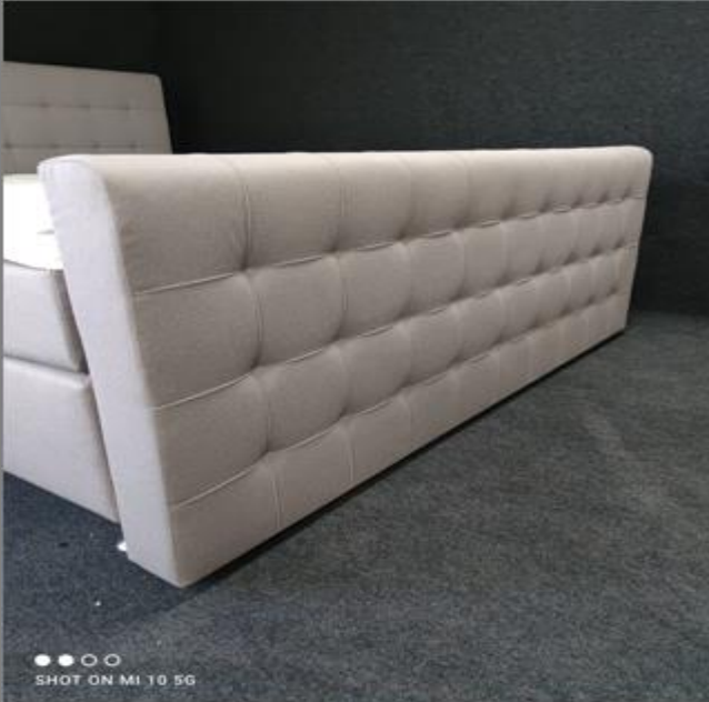
FT Space III