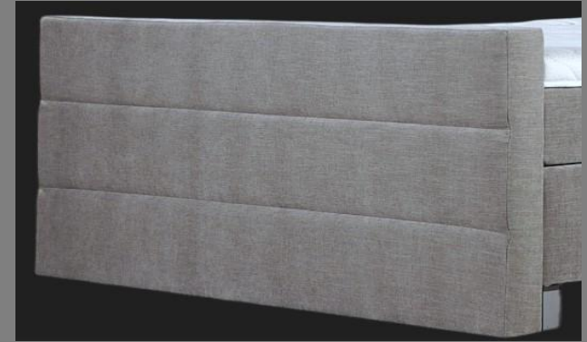
FT Topmotion 3