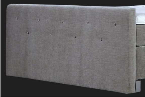
FT Topmotion 12