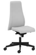
Drehstuhl mit niedriger, gepolsterter Rückenlehne