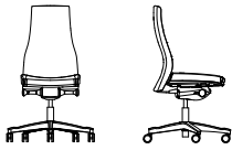
VIDEN SWIVEL CHAIR HB UPH PRO