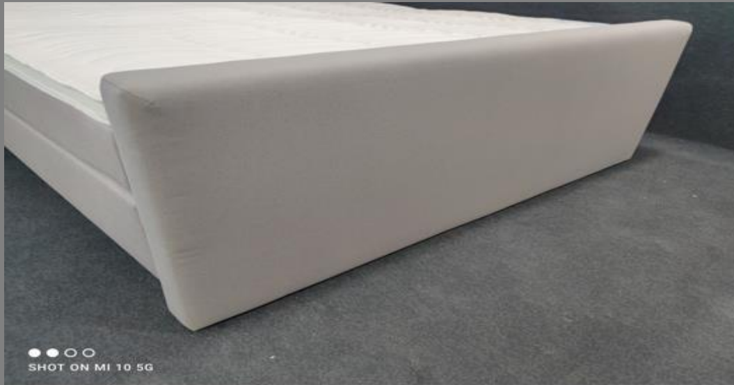
FT Space I