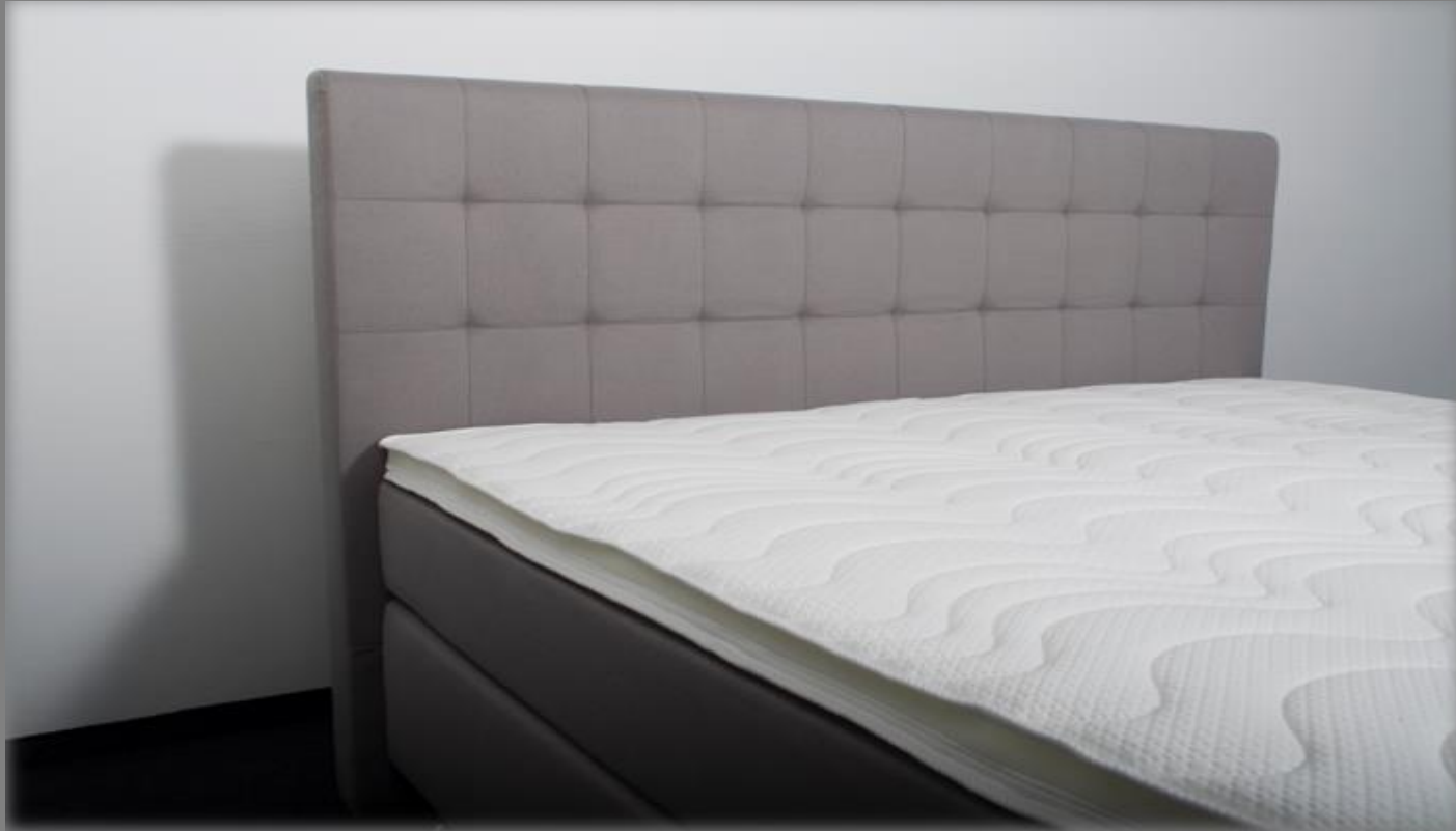
KT Space III