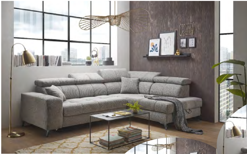
Glow 05 taupe