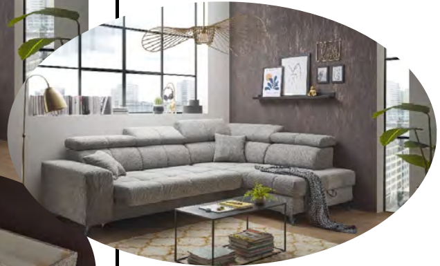
Glow 05 taupe