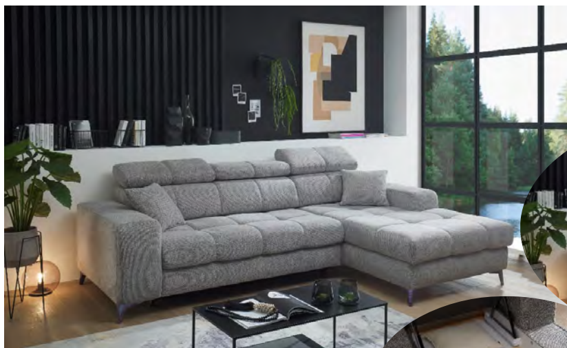
Glow 05 taupe